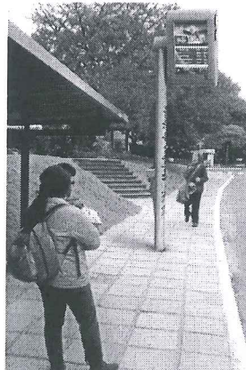
Modelo Estado do Rio de Janeiro

A presente proposição tem por finalidade sugerir ao Poder Executivo do Distrito Federal atender às reivindicações de usuários do transporte público do Distrito Federal. Todos os dias, trabalhadores, estudantes e pais de família vivem uma verdadeira humilhação diária e rotineira. Em plena capital do País, a população vem suportando o descaso do transporte público do Distrito Federal.