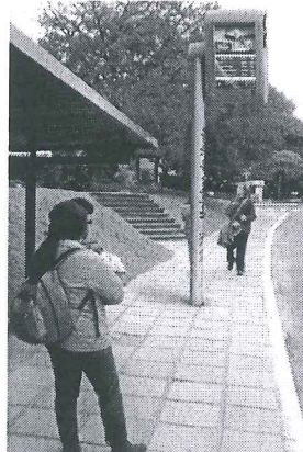
Modelo Estado do Rio de Janeiro

A presente proposição tem por finalidade sugerir ao Poder Executivo do Distrito Federal atender às reivindicações de usuários do transporte público do Distrito Federal. Todos os dias, trabalhadores, estudantes e pais de família vivem uma verdadeira humilhação diária e rotineira. Em plena capital do País, a população vem suportando o descaso do transporte público do Distrito Federal.