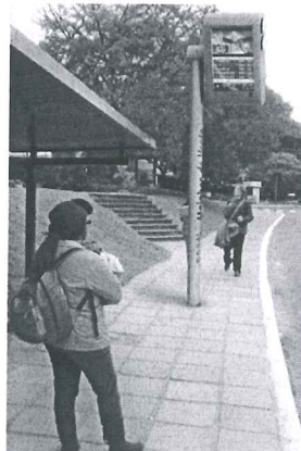
Modelo Estado do Rio de Janeiro

A presente proposição tem por finalidade sugerir ao Poder Executivo do Distrito Federal atender às reivindicações de usuários do transporte público do Distrito Federal. Todos os dias, trabalhadores, estudantes e pais de família vivem uma verdadeira humilhação diária e rotineira. Em plena capital do País, a população vem suportando o descaso do transporte público do Distrito Federal.