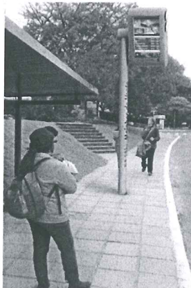
Modelo Estado do Rio de Janeiro

A presente proposição tem por finalidade sugerir ao Poder Executivo do Distrito Federal atender às reivindicações de usuários do transporte público do Distrito Federal. Todos os dias, trabalhadores, estudantes e pais de família vivem uma verdadeira humilhação diária e rotineira. Em plena capital do País, a população vem suportando o descaso do transporte público do Distrito Federal.