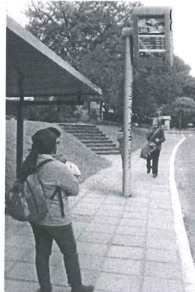
Modelo Estado do Rio de Janeiro

A presente proposição tem por finalidade sugerir ao Poder Executivo do Distrito Federal atender às reivindicações de usuários do transporte público do Distrito Federal. Todos os dias, trabalhadores, estudantes e pais de família vivem uma verdadeira humilhação diária e rotineira. Em plena capital do País, a população vem suportando o descaso do transporte público do Distrito Federal.