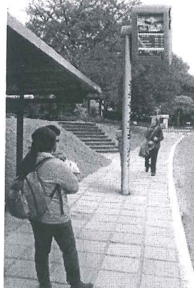
Modelo Estado do Rio de Janeiro

A presente proposição tem por finalidade sugerir ao Poder Executivo do Distrito Federal atender às reivindicações de usuários do transporte público do Distrito Federal. Todos os dias, trabalhadores, estudantes e pais de família vivem uma verdadeira humilhação diária e rotineira. Em plena capital do País, a população vem suportando o descaso do transporte público do Distrito Federal.