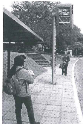
Modelo Estado do Rio de Janeiro

A presente proposição tem por finalidade sugerir ao Poder Executivo do Distrito Federal atender às reivindicações de usuários do transporte público do Distrito Federal. Todos os dias, trabalhadores, estudantes e pais de família vivem uma verdadeira humilhação diária e rotineira. Em plena capital do País, a população vem suportando o descaso do transporte público do Distrito Federal.