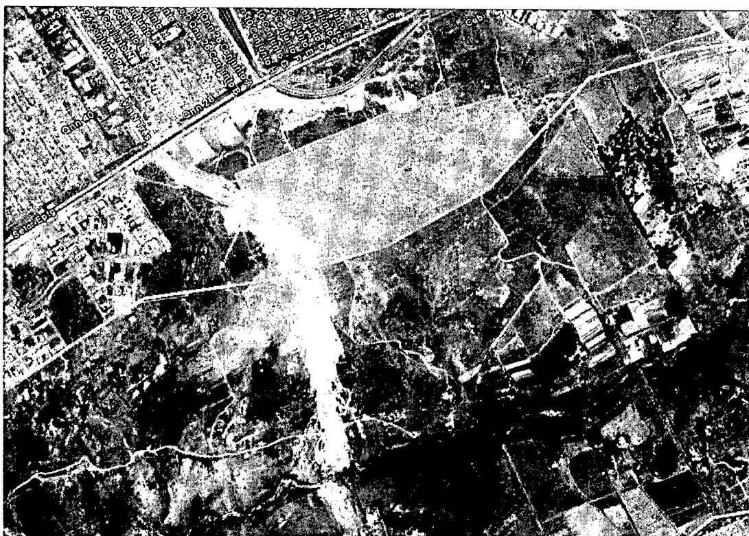
Figura 2. Localização do Parque de Uso Múltiplo Metropolitano, criado pelo Decreto nº 26.438 de 09 de dezembro de 2005; a linha cinza mostra o limite da Área de Relevante Interesse Ecológico JK (ARIE JK).

dezembro de 2005; o referido Decreto foi, porém, revogado pelo Decreto nº 27.979, de 28 de maio de 2007, que aprovou projeto de parcelamento para o lote onde se localizava o Parque. Sua localização é mostrada na Figura 2 abaixo: