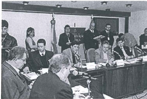
Grupo técnico volta a se reunir dia 7 de agosto

Edição: Gilmar Eitelwein