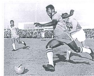
Pelé em jogo contra o Malmö FF, em 1960. O Brasil venceu por 7-1.