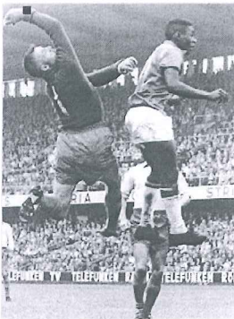
Pelé mostra sua extraordinária impulsão em jogo da Copa de 1958

Despedida: Maracanã, dia 18 de julho de 1971, com público de 138.575 pagantes. Brasil 2 a 2 Iugoslávia.