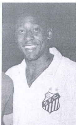
Pelé com a camisa do Santos em 1970

Um fato que destacou a importância de Pelé no exterior foi quando de sua visita à África em 1969. No transcorrer da guerra civil no Congo Belga, para que Pelé e o time do Santos transitassem em segurança entre Kinshasa e Brazzaville, as forças rivais declararam a interrupção das agressividades, chegando a ocorrer, numa região de fronteira, a transferência da delegação sob tutela de um exército para o outro.[18]