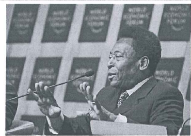
Pelé durante o Fórum Econômico Mundial em Davos, Suíça.