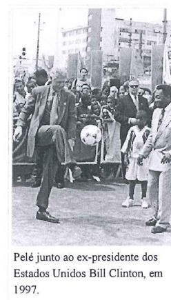
Pelé junto ao ex-presidente dos Estados Unidos Bill Clinton, em 1997.

espaço no noticiário por conta da prisão de seu filho Edson Cholbi Nascimento, o Edinho, autuado sob suspeita de envolvimento com o tráfico de drogas.