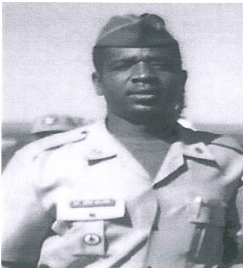
Imagens do Homenageado

inserindo adolescentes e jovens em ações sociais com inclusão e capacitação.