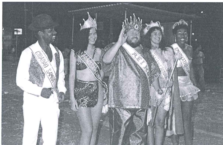
Imagens do Homenageado

Pertencente a Corporação do Grupamento de Bombeiros do Distrito Federal, servindo no quartel de Sobradinho, por opção e acompanhando a mesma formação de seu pai, contribuiu na criação da Brigada de Bombeiros Mirins em 1982, dedicando-se ao trabalho de combate à desvalorização da pessoa