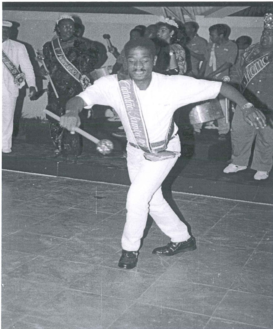
Imagens do Homenageado

Sua imensa contribuição cultural para o Distrito Federal se fez a partir da fundação do GRES Bola Preta de Sobradinho. Como um carioca apaixonado pelo samba, conquistou o título de CIDADÃO SAMBA, por 06 (seis) vezes. O samba, de um modo geral, e o Carnaval era a maior paixão desse carioca, que parecia ter asas de beija flor sob os pés, destreza de menino. Seus passos e gingados eram garantia de largos sorrisos e aplausos de todos.