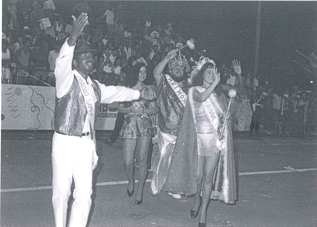
Imagens do Homenageado