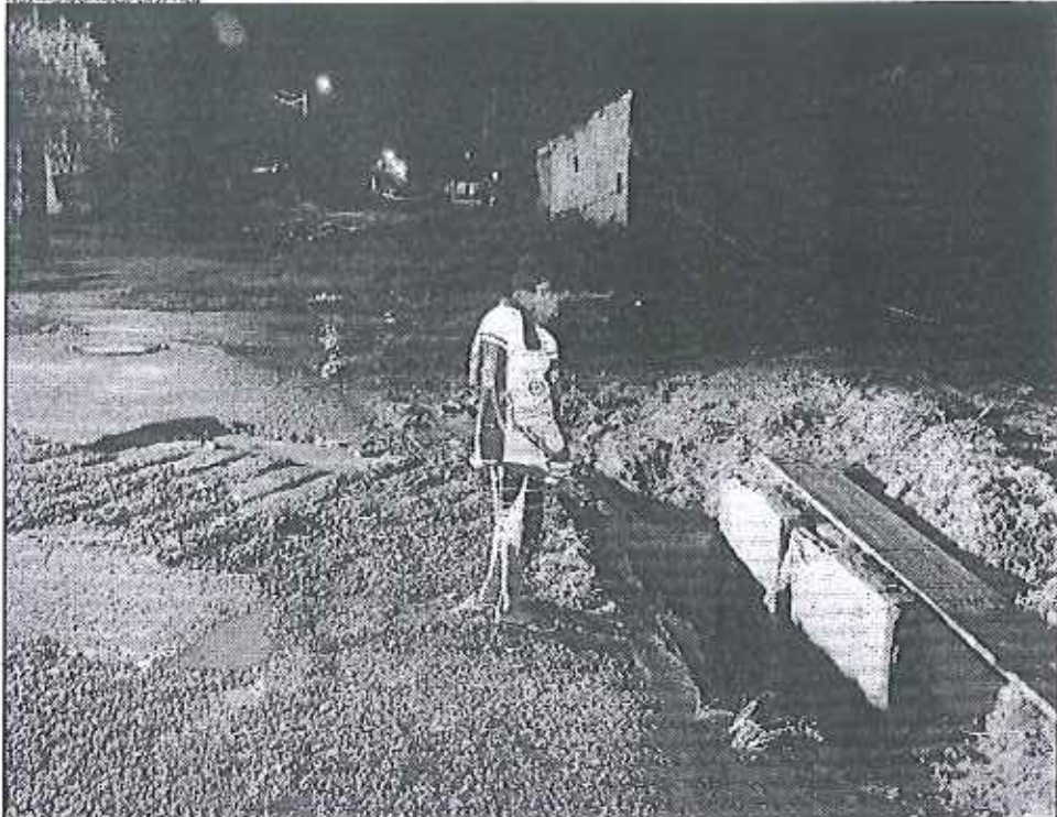
A boca de lobo pela qual Pedro Henrique foi sugado no bairro de Luziânia: sem tampa, é um risco à população do Jardim Ingá