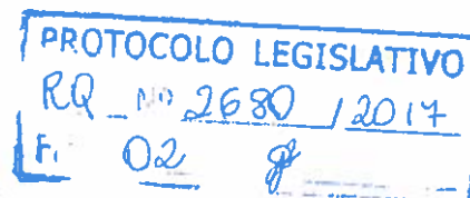
Deputado CLAUDIO ABRANTES REDE/DF