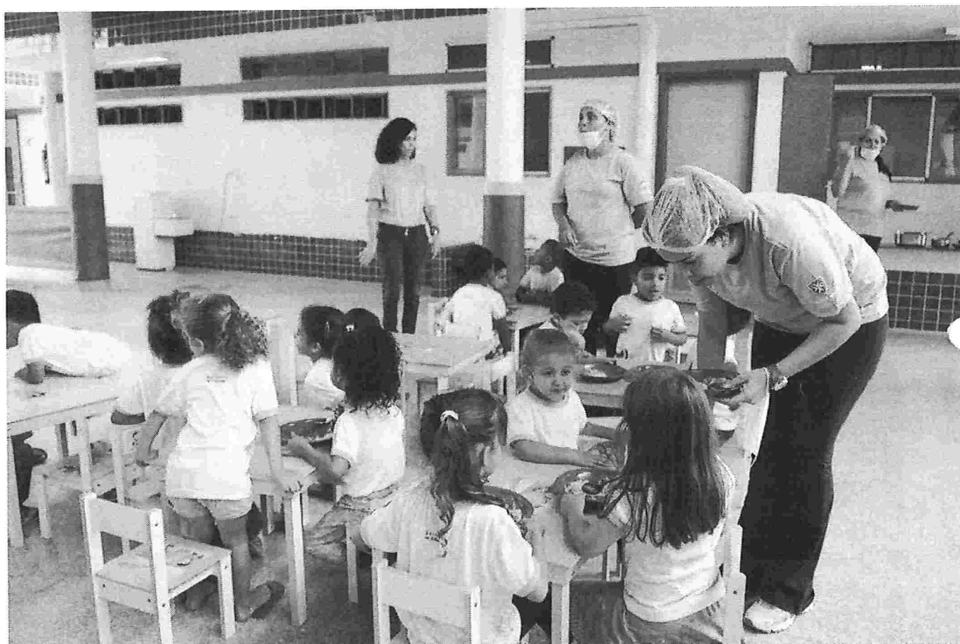
Crianças almoçam em creche João de Barro, em Sobradinho I, no Distrito Federal

As crianças serão alocadas em seis novos Centros de Educação da Primeira Infância (CEPIs) – dois deles estão prontos, a espera de mobiliário ( veja abaixo ).