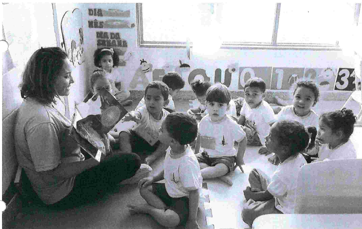
Crianças estudam em creche Canela de Ema, Sobradinho II, no Distrito Federal

07/02/2019 09h37 · Atualizado há 2 meses