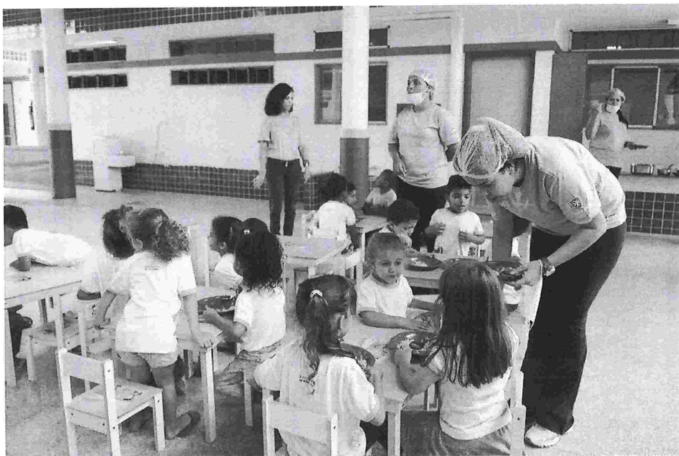
Crianças almoçam em creche João de Barro, em Sobradinho I, no Distrito Federal

As crianças serão alocadas em seis novos Centros de Educação da Primeira Infância (CEPIs) – dois deles estão prontos, a espera de mobiliário ( veja abaixo ).