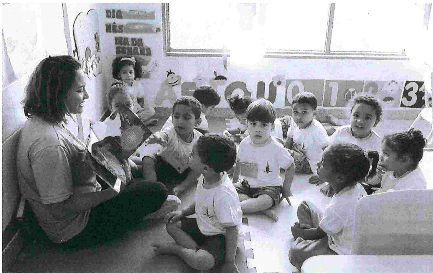
Crianças estudam em creche Canela de Ema, Sobradinho II, no Distrito Federal

07/02/2019 09h37 · Atualizado há 2 meses