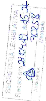
Deputado Roosevelt Vilela PSB

Setor de Protocolo Legislativo RQ Nº 411 / 2019 Folha Nº 01 mc