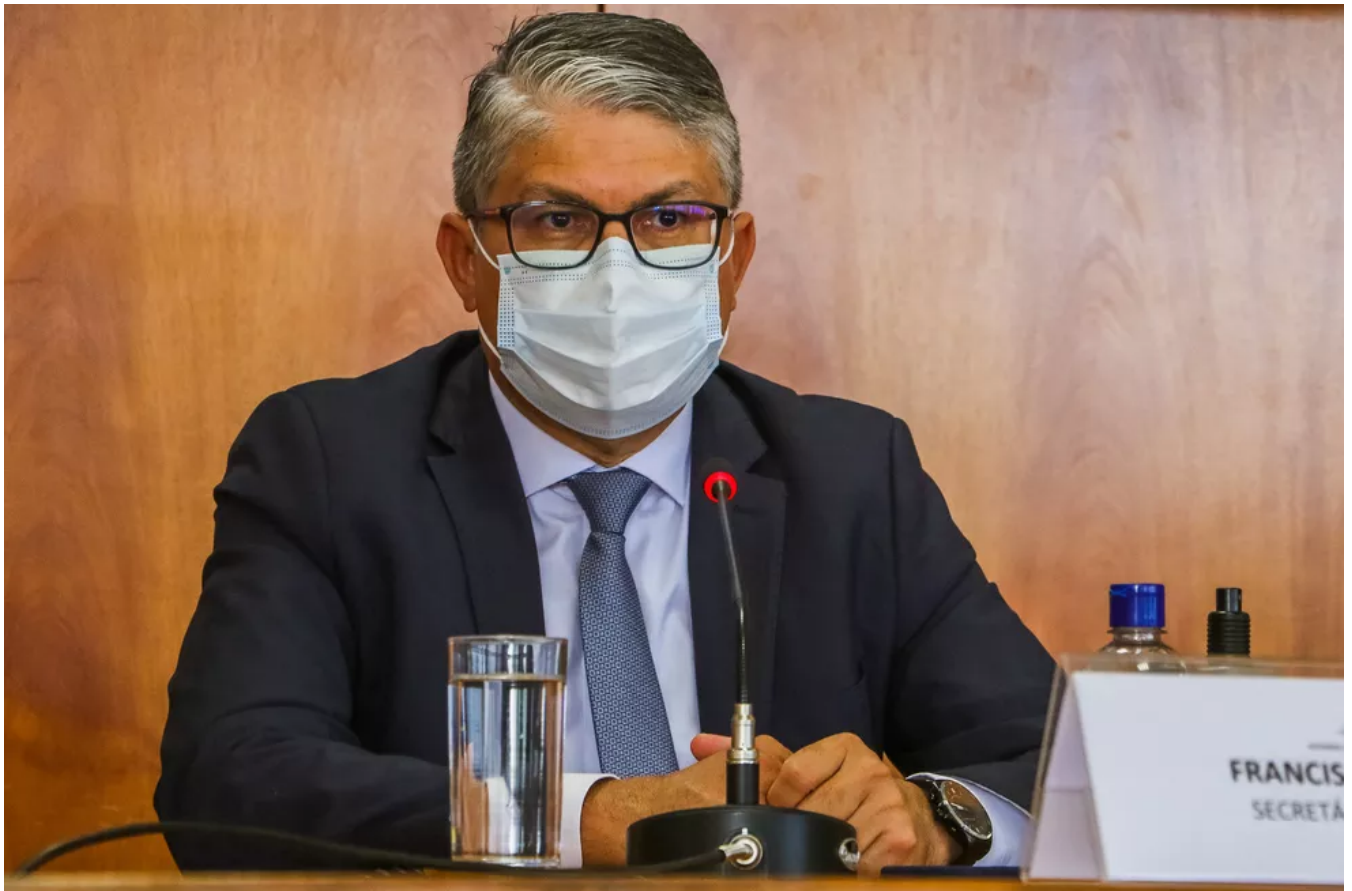
Secretário de Saúde do Distrito Federal, Francisco Araújo, em coletiva de imprensa

12/09/2020 08h59 · Atualizado há uma hora