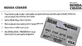
Renda Cidadã 2019 - Inscrições, Valor, Calendário, Consulta