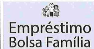
Empréstimo Bolsa Família