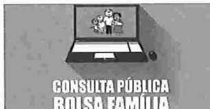
Bolsa Família - Consultar pelo Nome e Família é Verdade? CPF