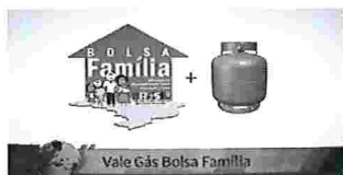
Vale Gás 2019 - Valor, Cadastro