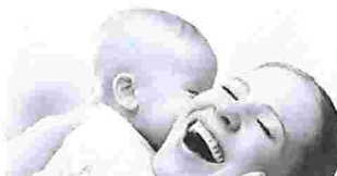
Salário Maternidade Bolsa Gestante - Quem tem direito?