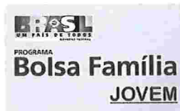
Bolsa Família Jovem - Inscrições