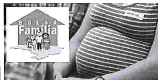
gravida tem direito a algum beneficio do governo