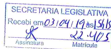
Deputado LEANDRO GRASS Rede Sustentabilidade