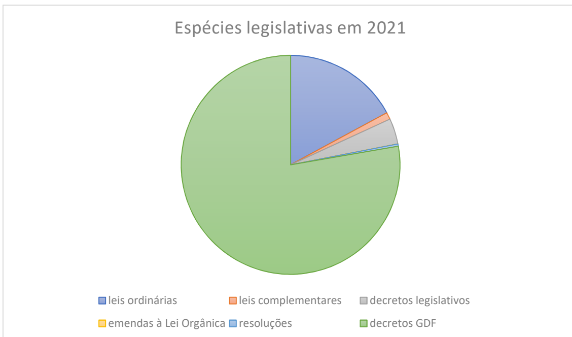
Gráfico 1: espécies legislativas informatizadas no Núcleo.